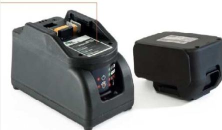
Chargeur de batterie