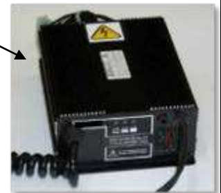
Chargeur rapide haute fréquence