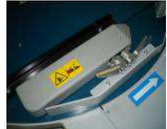
Pince de tenue du film étirable