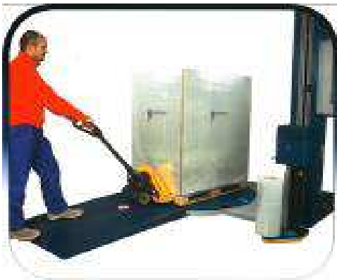
Rampe d'accès transpalette