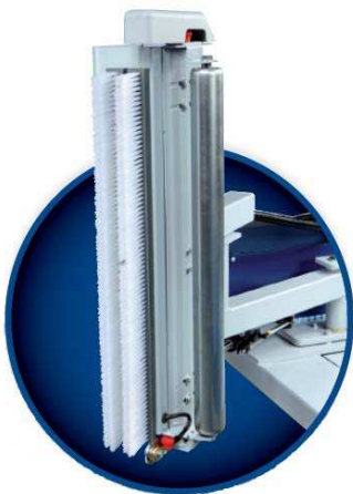
Brosse pour le placage du film sur la palette