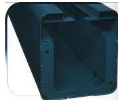
Mât mécano soudé / renforcé indéformable