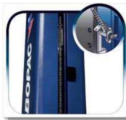
Chaine renforcée et protection antichute du porte bobine