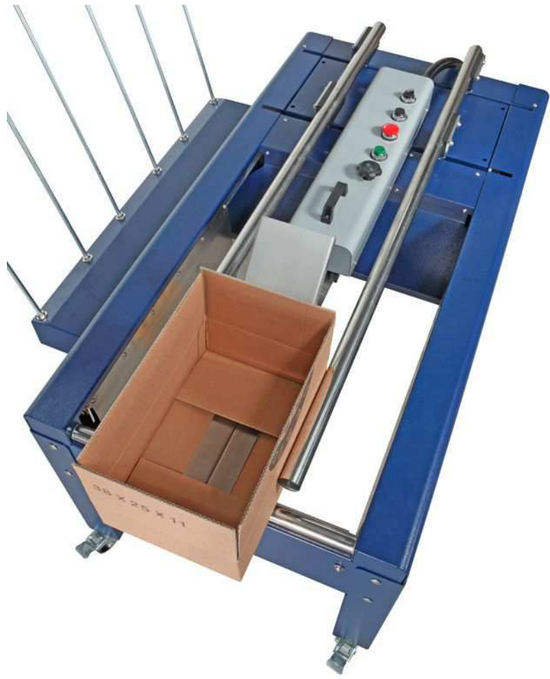
DIMENSIONS et ENCOMBREMENT de la STARBOX 50 et 65