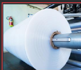
HOUSSE DE PALETTE STANDARD (80X120 ET 100X120)